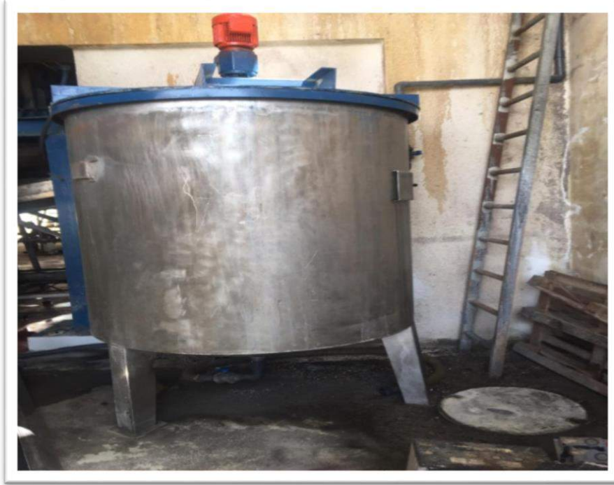
صورة رقم (12): خزان للمعالجة الإضافية