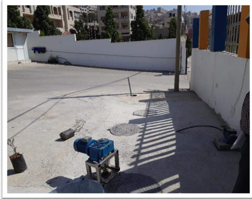
صورة رقم (11): وحدة المعالجة في مصنع دانا للأدوية البيطرية

تم اجراء عدة زيارات تهدف بضرورة تركيب المصنع لوحدة معالجة مسبقة حيث ان المصنع ربط بالمجرى العام الواصل الى محطة التنقية الغربية، ومن ضمن هذه الزيارات زيارة الاستشاري الالماني للمصنع حيث وضح لأصحاب المصنع طريقة المعالجة، تم إلتزام المصنع بتنفيذ جزء كبير من وحدة المعالجة المياه الصناعية على نفقته الكاملة كما وانه قام بفصل المياه المنزلية عن المياه الصناعية ليتم معالجة المياه الصناعية قبل تصريفها وسيتم اخذ عينة من المياه الصناعية المعالجة لتأكد من مطابقتها للقوانين والأنظمة الفلسطينية ذات العلاقة .