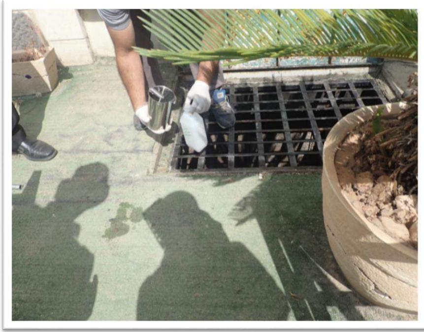
صورة رقم (1): اخذ عينة من صن تكس