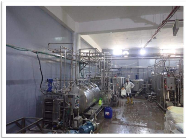
صورة رقم (7): من شركة الشنار للمواد الغذائية

تم زيارة المصنع والتعرف على المواد المستخدمة للإنتاج و على خطوط الإنتاج داخل المصنع (خط لإنتاج البودرة، خط تعبئة الزيوت، خط لإنتاج السوائل) كما يوجد في المصنع وحدة تعقيم يتم استخدام (هيدروكسيد الصوديوم، حمض الفوسفوريك)، سيتم اخذ عينة من المياه الصناعية العادمة الناتجة من المصنع لأجراء الفحوصات اللازمة بناء على طلب الربط على المجرى العام حسب اجراءات العمل المتفق عليها .