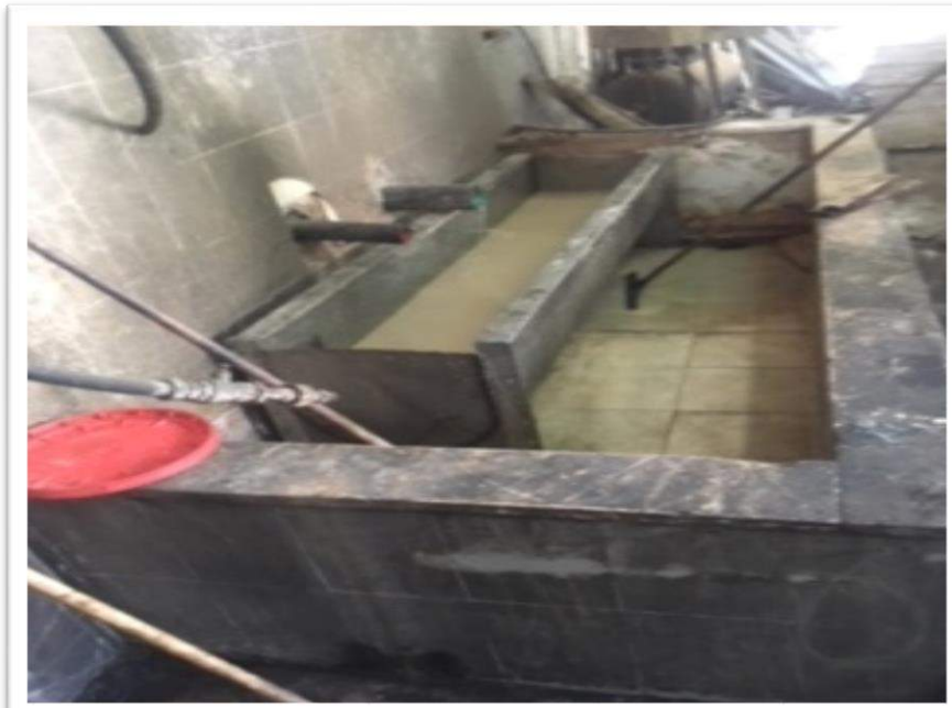
صورة رقم (4): من موقع اخذ العينة

بينت نتائج فحوصات عينات مياه ناتجه من غسيل السمسم ارتفاع في تركيز (COD, TSS) ان تنفيذ وحدة المعالجة المسبقة ( وحدة تقشير السمسم ) خفض تركيز الكلوريد في المياه الصناعية العادمة الخارجة من المصنع، تم منحه اذن ربط مؤقت بعد توقيع مدير المصنع على اتفاقية ربط للمياه الصناعية المعالجة على شبكة المجاري العامة .