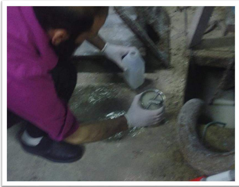
صورة رقم (2): اخذ عينة من شركة الدهانات

تبين من نتائج فحوصات عينه اخذت من الحفرة الامتصاصية التي يجمع بها المياه الصناعية الناتجة من غسل الآلات المستخدمة لإنتاج الدهان المائي والمياه العادمة المنزلية في المصنع وذلك بمقارنه النتائج بالأنظمة والمواصفات الفلسطينية المذكورة ارتفاع قليل جدا في تركيز COD، TDS و عليه سيترتب على المصنع دفع تعرفة مستقبلاً، و عليه تم منح المصنع اذن ربط مؤقت بعد توقيع مدير المصنع على اتفاقية ربط للمياه الصناعية على شبكة المجاري العامة .