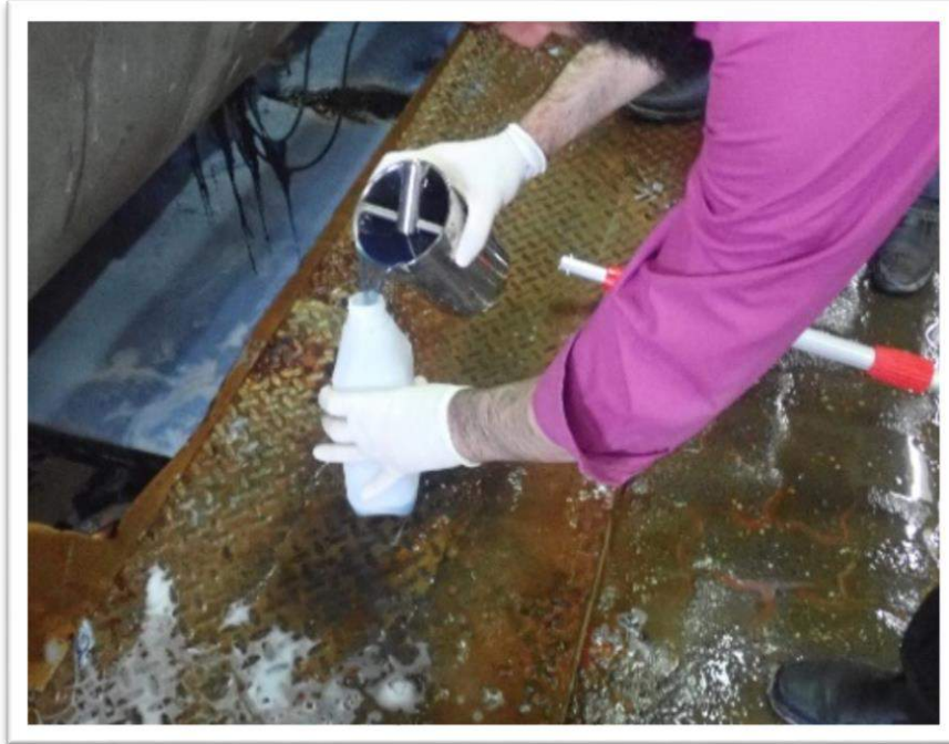
صورة رقم (3): أخذ عينة من شركة العقاد

تبين من نتائج فحوصات عينه اخذت من المياه الصناعية العادمة الناتجة من غسيل الجينز وذلك بمقارنه النتائج بالأنظمة والمواصفات الفلسطينية المذكورة انه يمكن ربط مياهه العادمة الصناعية على المجرى العام وعليه تم منحه اذن ربط مؤقت بعد توقيع مدير المصنع على اتفاقية ربط للمياه الصناعية المعالجة على شبكة المجاري العامة .