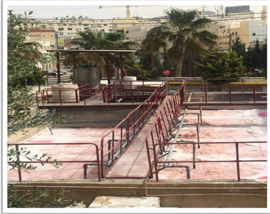
صورة رقم (15): من وحدات معالجة مسبقة لمصنع ادوية

تلقي طاقم وحدة الرقابة البيئية دورة ( برنامج الإدارة المتكاملة للمياه الصناعية ودائرة المختبرات والنوعية / سلطة المياه / عمان - الأردن ) هدفت الدورة على تدريب الطاقم على طرق المعالجة المسبقة للمياه العادمة الصناعية الخارجة من المصانع والتشريعات المحلية النازمة للمياه العادمة الصناعية ونظام الرقابة على المياه العادمة الصناعية والتراكيز المثالية في الصرف الصناعية وتصنيف المياه الصناعية، كما وتم الاستفادة من كيفية احتساب التعرفة المستخدمة ( الأجر الإضافية للمعالجة ) والحد الأعلى المسموح به للربط و الحد الأقصى المسموح به مقابل الأجر الإضافية .