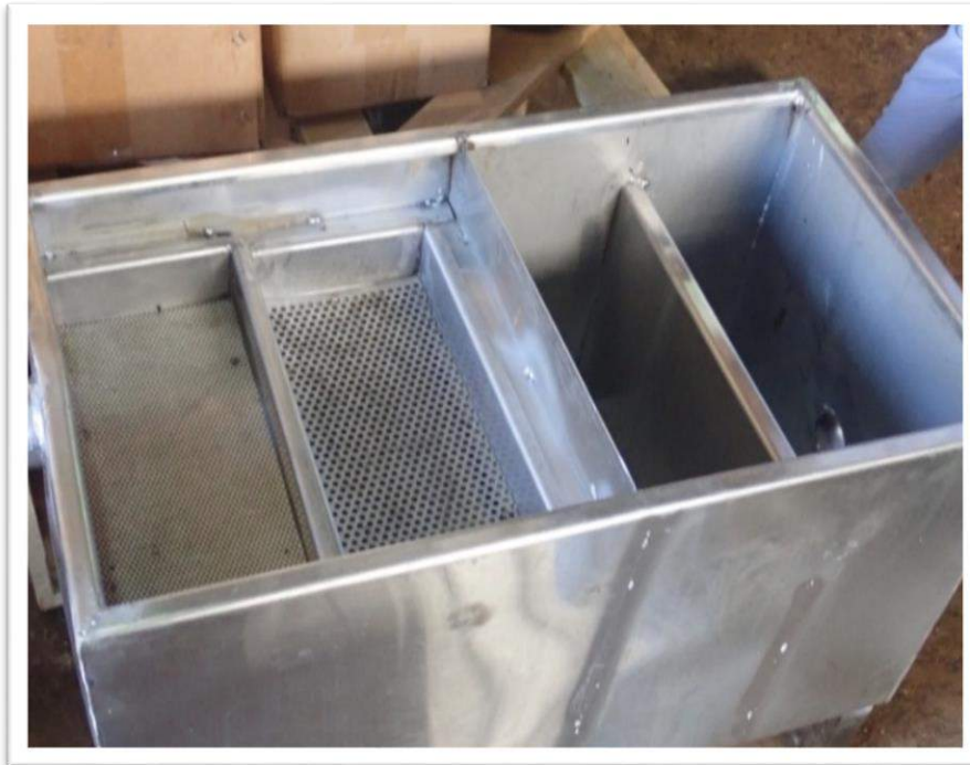
صورة رقم (13): مصيدة دهون

تم اجراء العديد من الزيارات للمطاعم ومحلات الحلويات تم من خلالها توزيع اخطارات تلزمهم بضرورة تركيب مصيدة دهون، حيث تم تركيب (عدد11) وحدة مصيدة دهون .