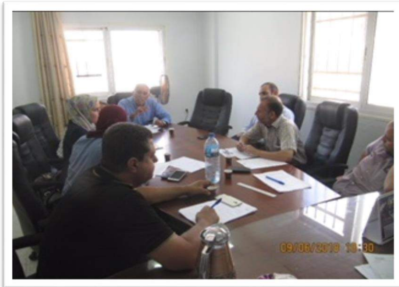
صورة رقم (10): اجتماع بخصوص ملاحم ديرشرف

قامت الملاحم بالربط الغير قانوني على المجرى العام الواصل الى محطة التنقية الغربية حيث ان المياه الناتجة من عملية الذبح تحتوي على مواد عضويه تسبب في زيادة التكاليف التشغيلية للمحطة، تم اجتماع لجنة الصحة والسلامة العامة بوجود اصحاب الملاحم وتم توقيع اصحاب الملاحم على اتفاقية تعهد والتزام بخصوص الربط على المجرى العام ليتم دفع ما يترتب عليهم من بدلات معالجه، كما واتفق الجميع على ضرورة توفير مسلخ يتوفر به كافة الشروط اللازمة للترخيص ويتم متابعة انشاء المسلخ مع مجلس قروي ديرشرف ووزارة الزراعة - دائرة البيطرة ووزارة الصحة .