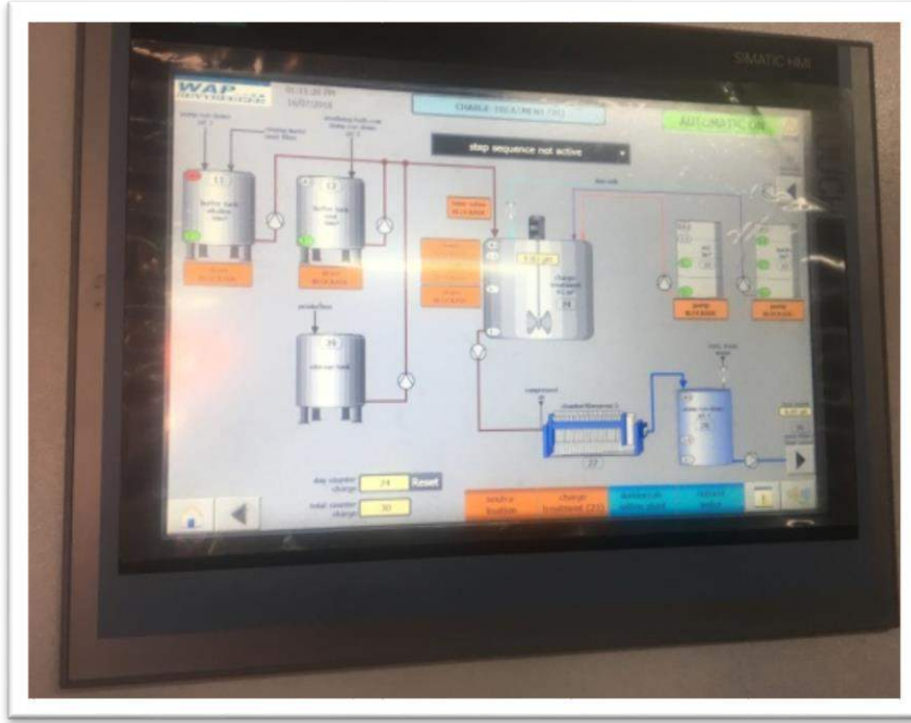
صورة رقم (9): من لوحة وحدة المعالجة مصنع الالمنيوم