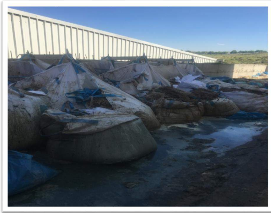
صورة رقم (8): مخلفات من شركة حازم للدباغة

ويقع هذا المصنع في المنطقة الصناعية في قرية دير شرف، تم زيارة لجنة الصحة والسلامة العامة للمصنع الذي يعمل مخالفا للشروط الصحية والبيئية وغير ملتزم بشروط الصحة والسلامة العامة، كما وانه يقوم بتصريف مياهه العادمة الصناعية التي تحتوي على عنصر الكروم على مجرى الوادي مسبباً بذلك خطراً على المواطن والبيئة بكل جوانبها، وعليه تم الاجتماع مع صاحب المصنع في المحافظة وتم توقيعه على تعهد يلزمه بعدم تشغيل المصنع الا بعد تسوية أوضاعه واخذ كافة التراخيص اللازمة من كافة الوزارات ذات العلاقة، قام فريق وحدة الرقابة بزيارات دوريه للمصنع للتأكد من إلتزامه وتبين من الزيارات ان المصنع لا يعمل .