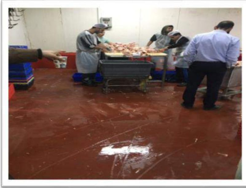
صورة رقم (6): من شركة التل الأخضر

تم زيارة الشركة والتعرف على مراحل الذبح وكيفية التخلص من نفاياته الصلبة والسائلة حيث يتم التخلص من النفايات الصلبة والدم في مكب زهرة الفنجان اما بالنسبة للمياه المستخدمة في التنظيف يتم تجميعها وتستخدم في ري المزروعات داخل حدود الشركة .